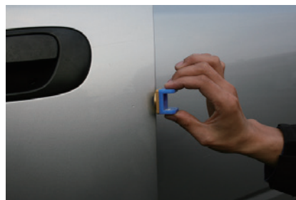
クリア塗装時のタレ除去に最適！