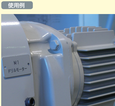
機械の名称表示などに