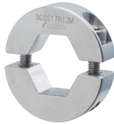
無電解ニッケルメッキ