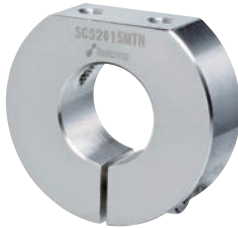
無電解ニッケルメッキ