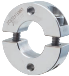
無電解ニッケルメッキ