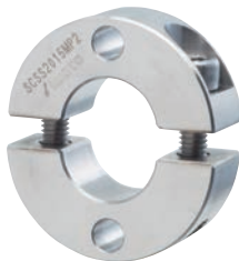
無電解ニッケルメッキ