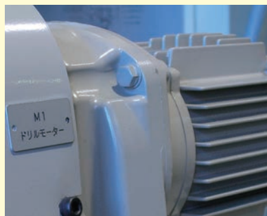
機械の名称表示などに